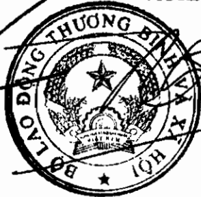
Nguyễn Thị Kim Ngân